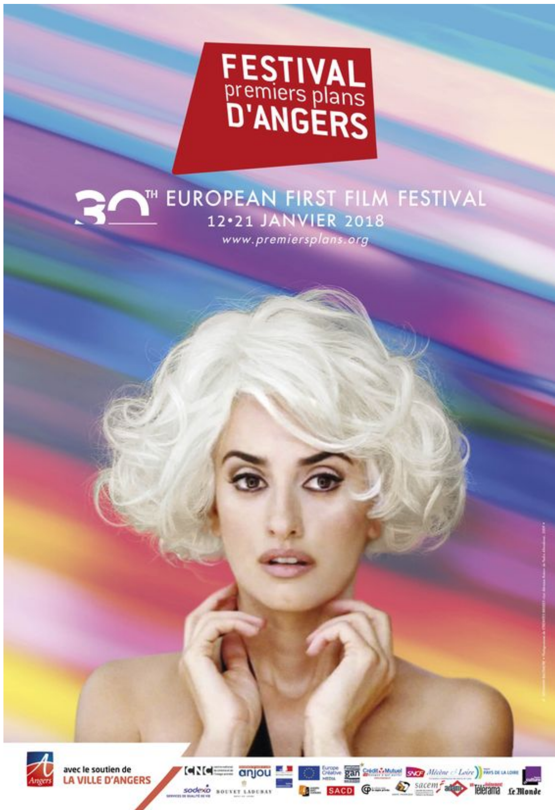
Figure 4 : Affiche Festival Premiers Plans 2017 © Benjamin Baltimore.

Cette entrée en matière nous a permis d'évoquer la biographie du cinéaste, son contexte socio-historique (Madrid, La Movida, Franco, etc.) puis ses œuvres, dont les extraits les plus emblématiques ont été analysés (importance des femmes à l'écran, thèmes du secret de famille et de l'identité sexuelle, mises en abyme, etc.).